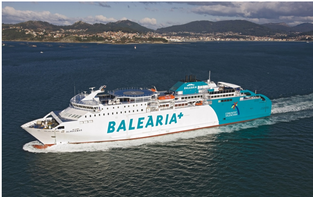
Balearia opera una de las flotas más modernas del Mediterráneo