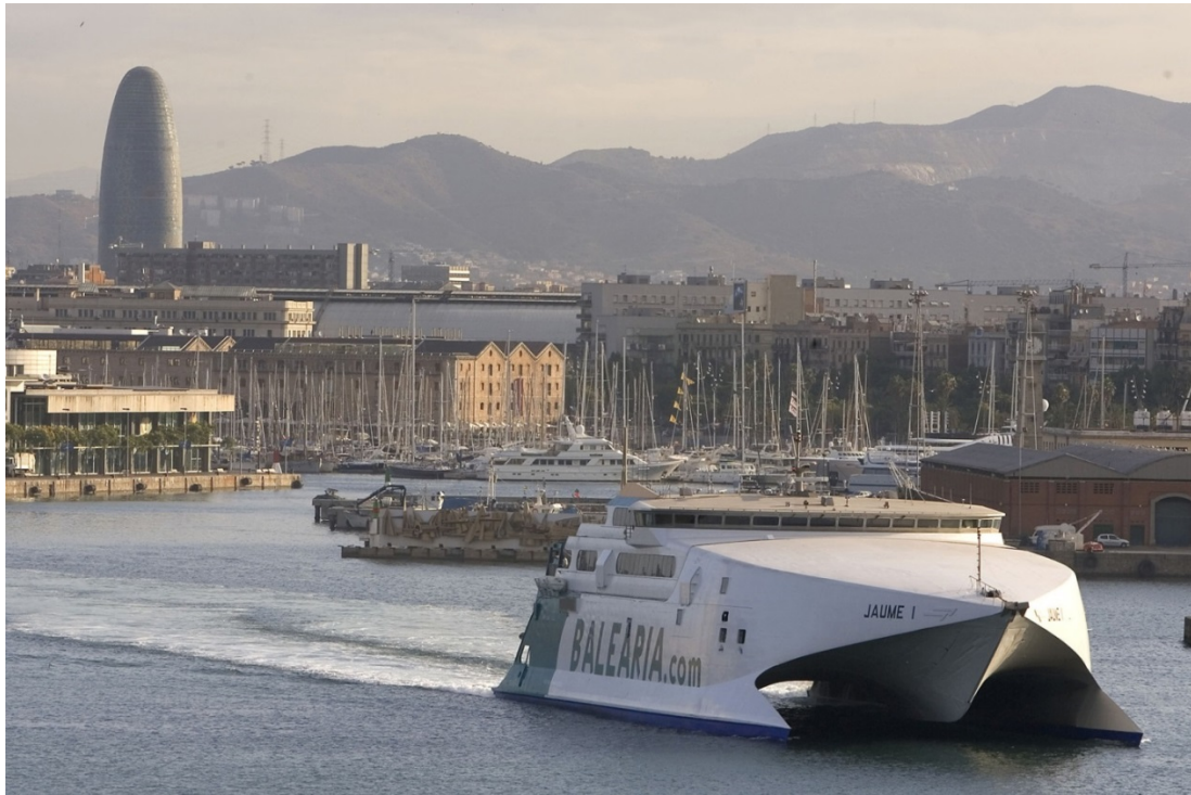
El HSC "Jaume I" de Balearia partiendo desde Barcelona